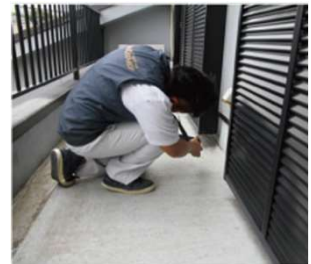
防水層の劣化、亀裂等の確認