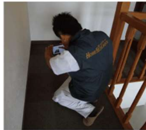
入隅の隙間、亀裂などの確認