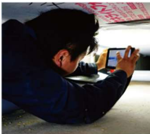
基礎のヒビ、カビ、腐食の確認